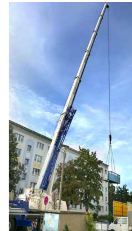
Balkonanbau in der Enzianstraße

im Laufe des Jahres die vielen kleinen Baumaßnahmen im Bestand registriert. Auch dieses Jahr wurden in vielen unserer Häuser nach und nach die Kellerverschlüsse erneuert und Treppenhäuser saniert. Die Fassaden vieler Häuser wurden farblich aufgefrischt. Wir freuen uns sehr über diese Fortschritte in unseren Bestandshäusern. Mit all diesen Maßnahmen runden wir das gute Bild unserer Objekte ab und schaffen einen Mehrwert für unsere Heimatstadt Bernau.