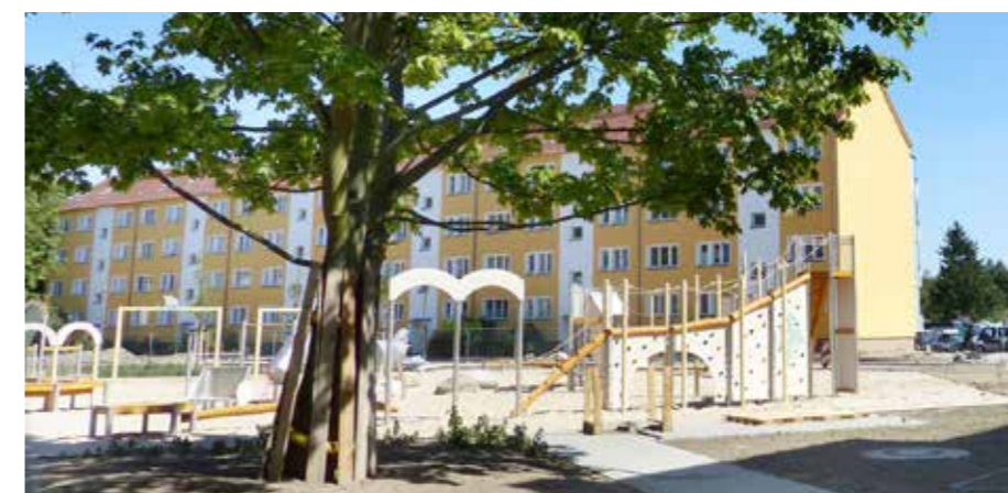
Römerspielplatz, An der Viehtrift

In unserer letzten Mieterzeitung informierten wir bereits über das Thema