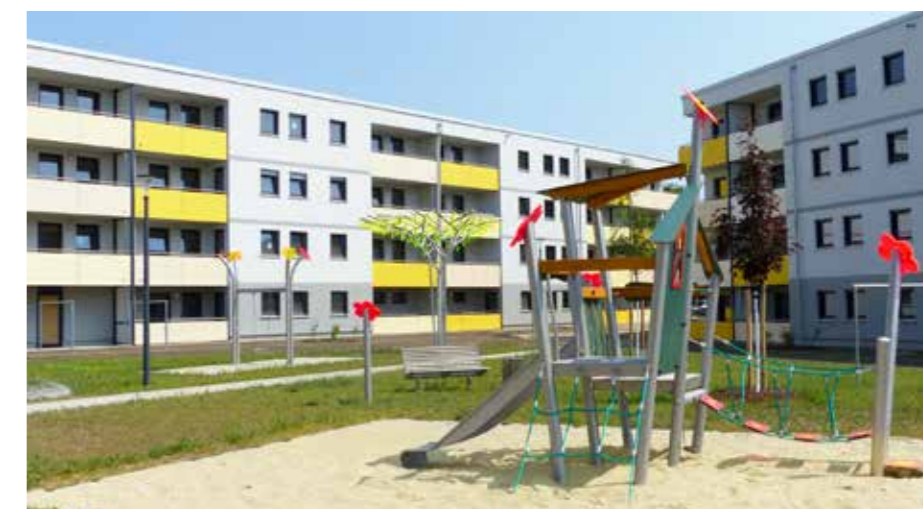
Unser Neubau in der Schönower Chaussee/Im Blumenhag

Rauchwarnmelder. Zwischenzeitlich wurden bereits 2/3 aller Wohnungen mit Rauchwarnmeldern ausgestattet. Das letzte Drittel wird im kommenden Jahr umgesetzt, so dass wir weit vor dem vorgeschriebenen Termin alle Rauchwarnmelder installiert haben werden. In 2018 wurde natürlich auch viel instandgesetzt, so wurden z. B. vorwiegend im Viehtrift-Viertel Strangsaniierungen durchgeführt und Balkone erneuert. Ganz besonders können sich die Mieter aus der Enzianstr. 1-7 und der Eberswalder Str. freuen, sie erfahren nun durch den Anbau eines Balkons mehr Wohnqualität. Im Puschkinviertel konnten die Erneuerungen der Wohngebietsstraßen noch in diesem Monat abgeschlossen werden. Die Mieter an der Viehtrift können sich ebenfalls über die Verbesserung der Wohngebietsstraße freuen.