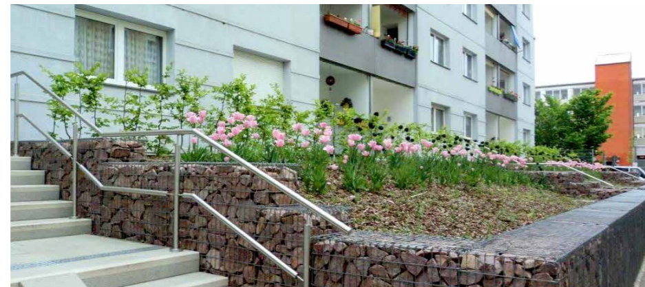
Die Häuser in der Neuen Straße 1-3 haben neue Treppenanlagen und schöne Bepflanzungen erhalten.

Liebe Kinder, füllt die leeren Felder so aus, dass in jeder Zeile und in jeder Spalte sowie in jedem Unterquadrat (3x3 Kästchen) alle Ziffern von 1 bis 9 genau einmal vorkommen. Es gibt nur eine richtige Lösung. Habt Ihr das Sudoku gelöst, kommt bei uns am Service der WOBAU vorbei und holt Euch eine kleine Überraschung ab. Viel Erfolg!