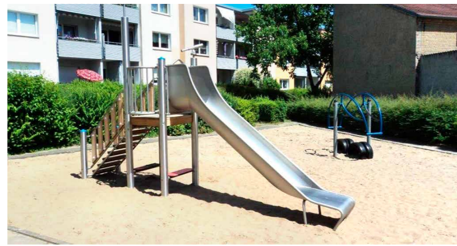
Auf dem Spielplatz in der Wohnanlage Breite Straße/Hohe Steinstraße/Kirchgasse wurde eine neue Rutsche aufgestellt.