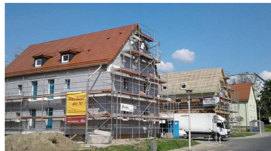
Sanierung Puschkinstraße 15 und 17