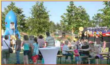
Eröffnung des Planetenparks in Bernau Süd