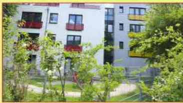
Neubauten am Kützpark