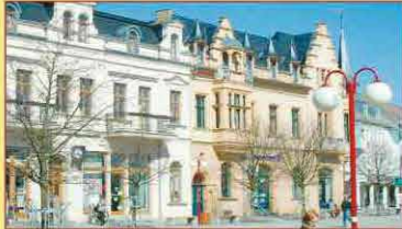
Bürgerhäuser der WObAU am Marktplatz