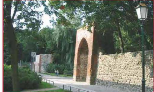
Bernau bietet seinen Bürgern ein angenehmes Wohnen und jede Menge Reizvolles egal ob Kultur,

Die grüne Stadt am Rande Berlins hat in den vergangenen Jahren einen bedeutenden Aufschwung vollzogen. Das Stadtbild wird geprägt von der gut erhaltenen Stadtmauer, die den Stadtkern völlig umschließt und vom grünen Gürtel der Wallanlagen. Rekonstruierte und neu erbaute Häuser fügen sich gemeinsam in den Charakter der alten Stadt ein.